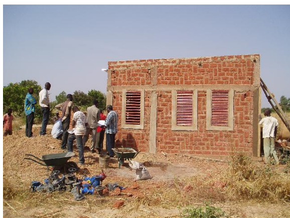
Práce na vybudování domku s technickým zázemím pro jímací území Toma–sever