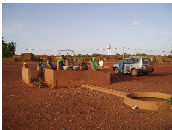
Tradiční ručně kopaná studna s rumpálem v Toma