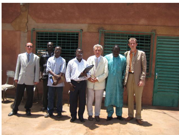
Pracovní setkání s představiteli radnice města Toma.