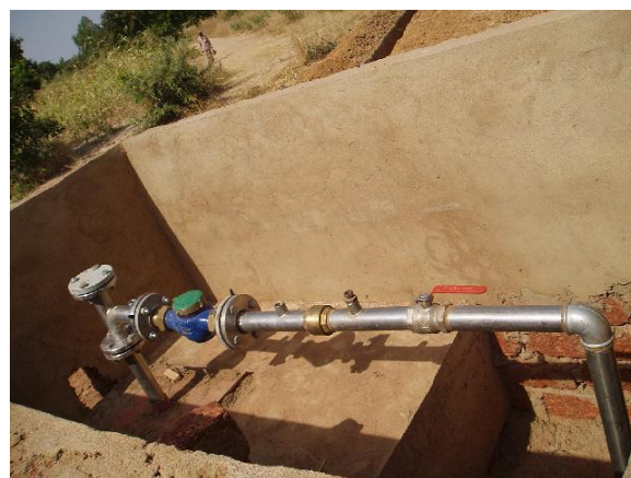
Nově vystrojený vrt No.A1 v jímacím území Toma–sever