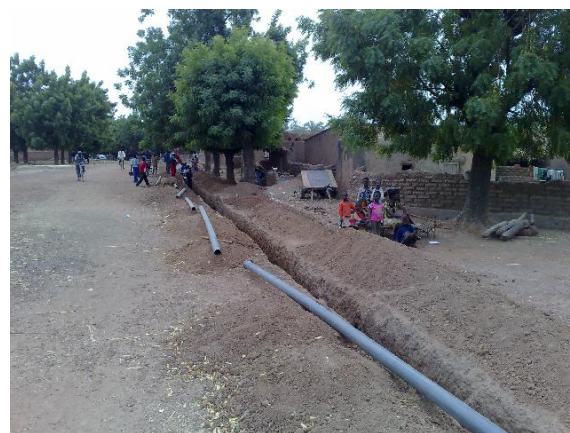
Pokládání vodovodního potrubí a přípojek v Toma